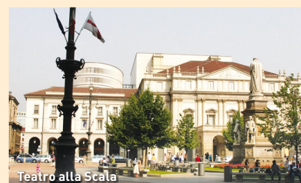
Teatro alla Scala

Tipp: Geführte Besichtigung des Doms (Deutsch/ Englisch), der Galleria Vittorio Emanuele, des Piazza Scala und des Museum delle Scala.